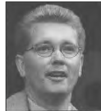
Justitsminister Frank Jensen (S) taler, når LO holder 1. maj møde i Aabybro Lystanlæg.

Udover talerne vil der være hoppeborg for børnene, musik og fællessang under arrangementet, oplyser LO.