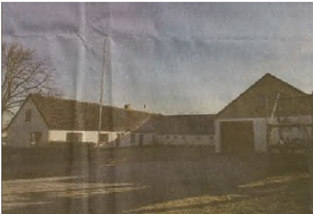
FDF Aaby-Vedsted kan blive på Bakgården i mindst fire år endnu, trods planerne om byggeri på nabogrunden. Dog indskrænkes FDF's friarealer sandsynligvis. MARTIN DAMGAARD