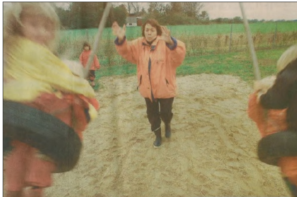
Børnehaverne i Aabybro Kommune, her i Thomasmindeparken, slipper for besparelser.