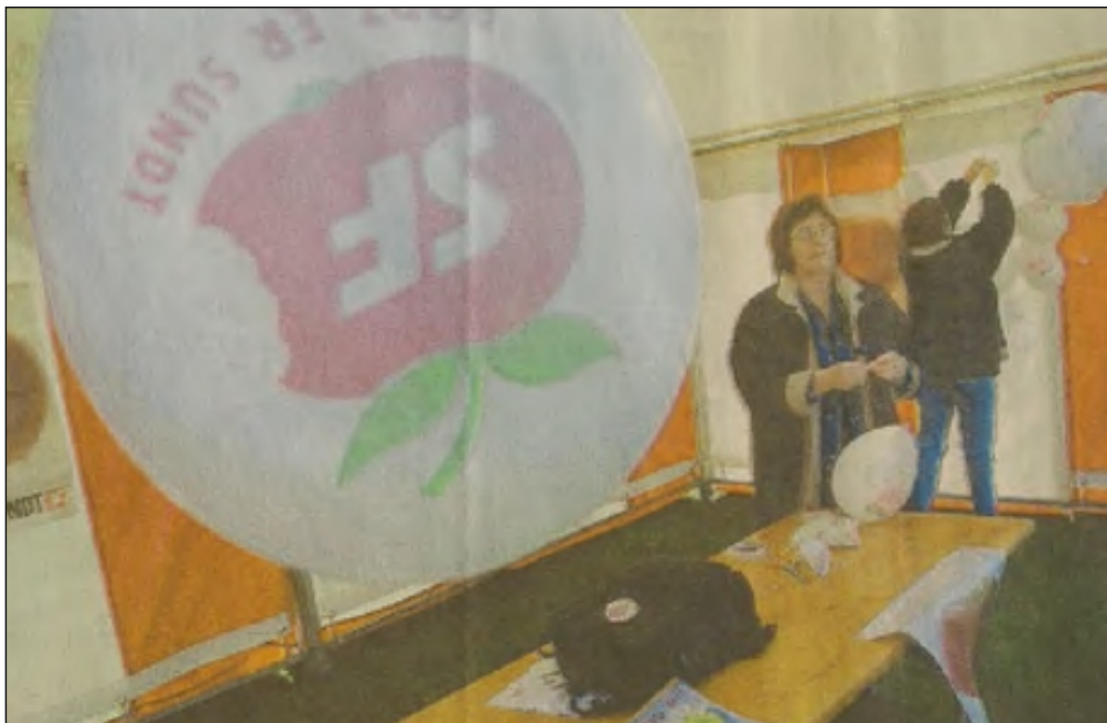
SF havde slået et telt op, hvor der bl.a. blev uddelt balloner.

kommuner, stat og amter skal blot være et redskab til at skabe et bedre samfund, var budskabet fra amtsborgmesteren.