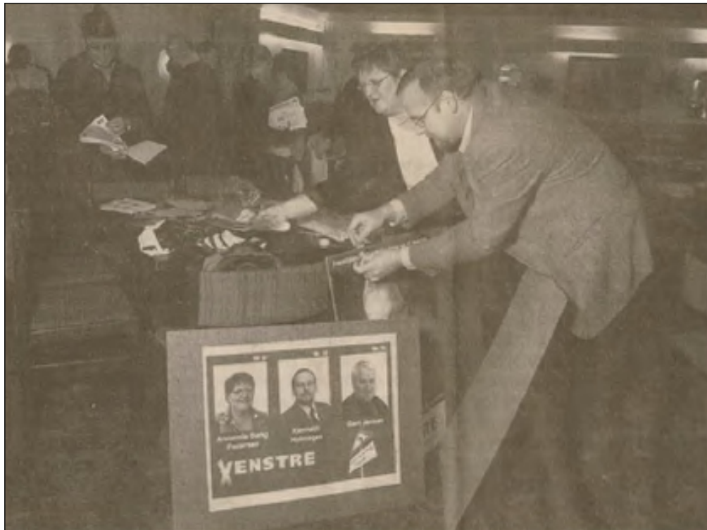
Byråds kandidater ne havde travlt med gøre valgmaterialerne klar, inden mødet på Birkelse Kro.