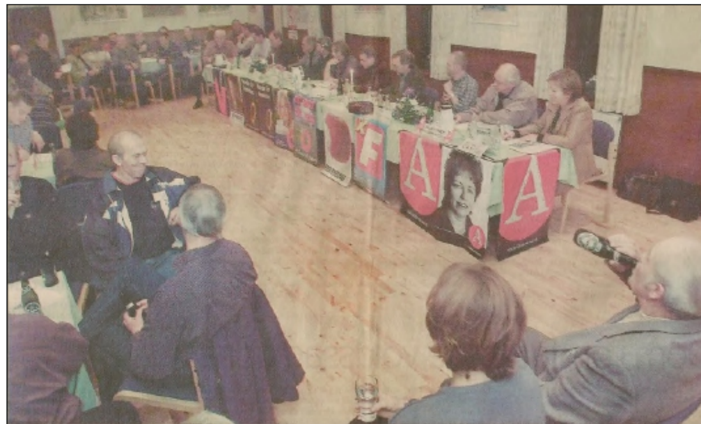
GJØL: Valgkampen handler ikke bare om udlændinge, ventelister og terror. I de nære samfund diskuteres de nære ting - som f.eks. på det gode gammeldags kommunale valgmode her på Gjøl Kro, hvor diskussionen bl.a. gik på 7. klassernes fremtid på de små skoler. Er de nye overbygningscentre sagen, eller bør eleverne i 7. klasse få lov at være de store blandt de små og slippe for pres fra større kammerater, som er i fuld gang med fester, kærester og de første skridt mod et sexliv.