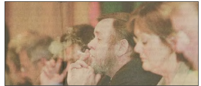
Kandidaternes synspunkter skar sig igennem cigaretrøgen i Nørhalne Forsamlingshus.