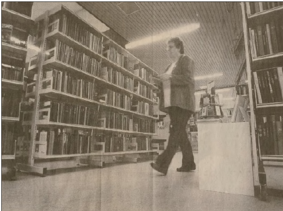
Aabybro Bibliotek og filialerne får nye åbningstider.