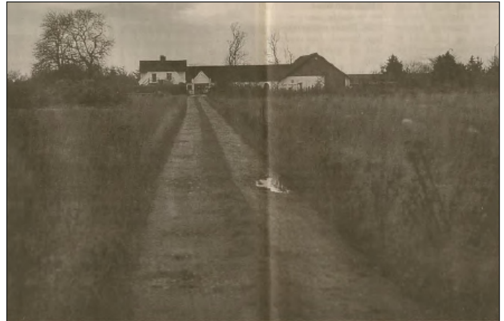
Aabybro Rådhus får i fremtiden boliger og muligvis liberale erhverv som nærmeste nabo.