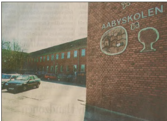
Meget tyder på, at Aabybro Skole også fremover må holde til på to forskellige adresser.

AABYBRO: En arbejdsgruppe under Aabybro Skole arbejder med forslag om en samling af indskoling og SFO'er i en ny tilbygning på