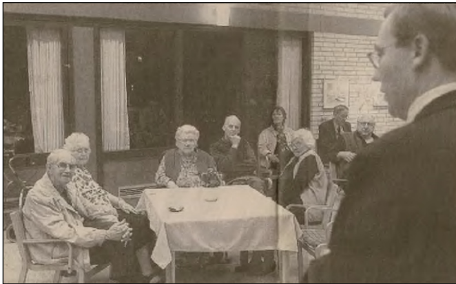
Omkring 40 var mødt op til vælgermødet på Aabybro Plejehjem