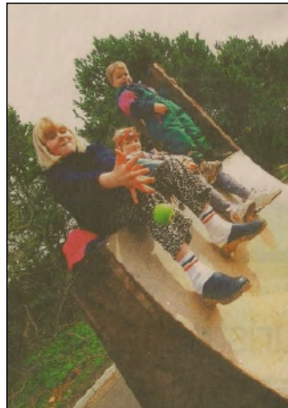
Indførelse af klippekort til børn i SFO II, som i Hullet, kommer alligevel ikke til at gå ud over søskenderabat.

Derfor kan institutioner og forældre allerede nu vælge mellem klippekort eller den nuværende ordning for