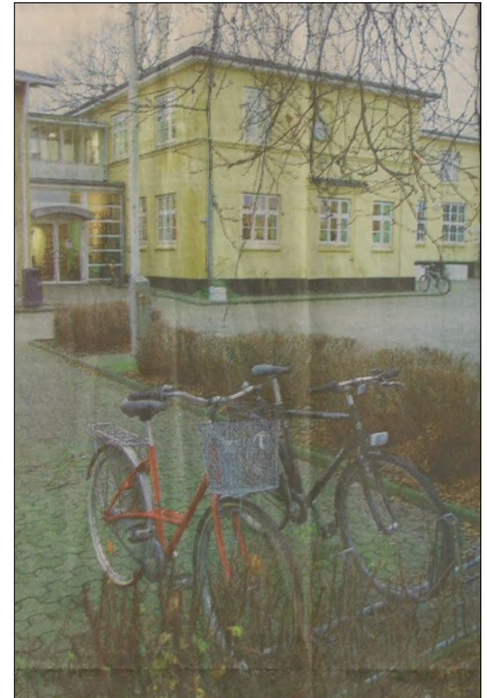
Skal Aabybro Skole fortsat holde til i en rød og en gul bygning på hver sin vej? Eller skal den samles på én matrikel? Det er et af spørgsmålene fra skolebestyrelsen.

-Skemaerne er et værktøj til at få politikernes holdning frem inden valget, og et værktøj til at fastholde deres udsagn efter valget,