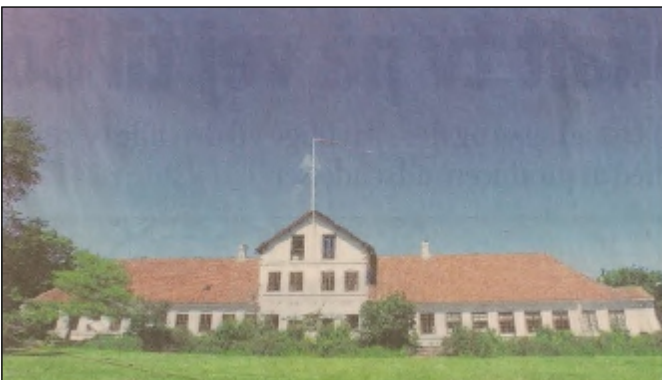
Birkumgaard er blandt de områder, der i følge amtets forslag til regionplanen har en særlig kulturel værdi. MARTIN DAMGÅRD

Ole Hermansen syntes, det er mystisk, at