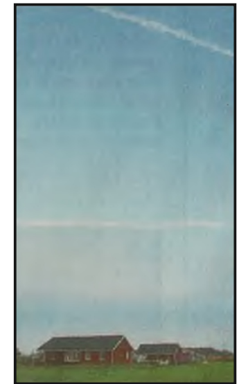
Anden etape af byggemodning i Thomasmindeparken er klar.