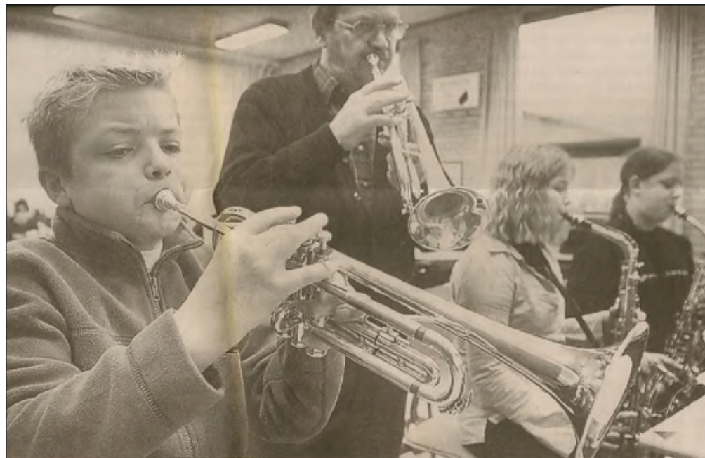
Antallet af elever, der får soloundervisning i Aabybro Kommunes Musikskole er faldet med 70 procent - til gengæld er antallet af børn på holdundervisning højere end før.