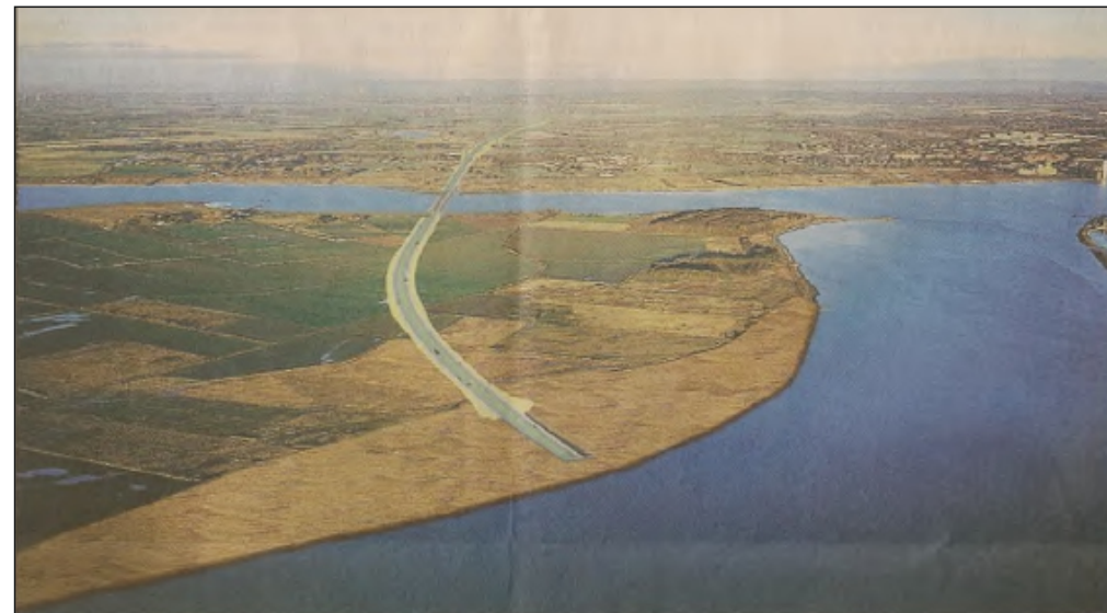
En af mulighederne er en vestforbindelse over Egholm.