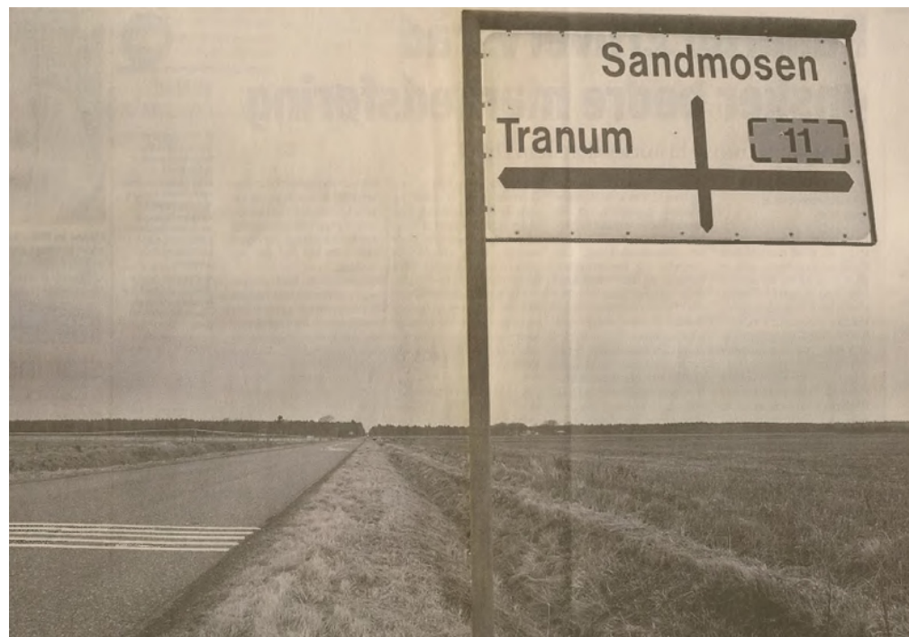
Selv om dette kryds er overskueligt, er det farligt, og derfor skal vejen forskydes, så krydset ikke længere er firbenet.

Det blev dengang anslået at koste ca. 250.000 kr.,